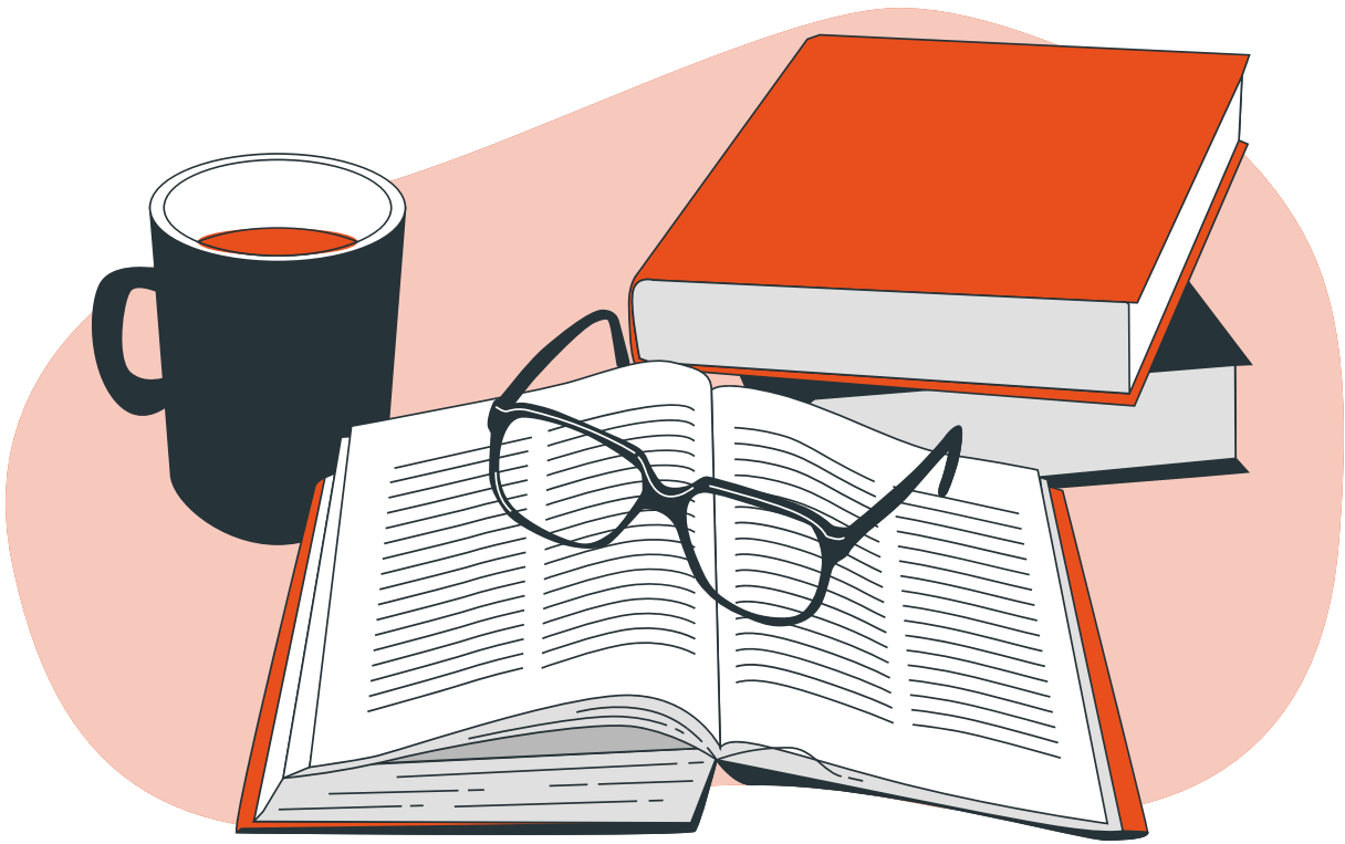
Illustration : storyset.com