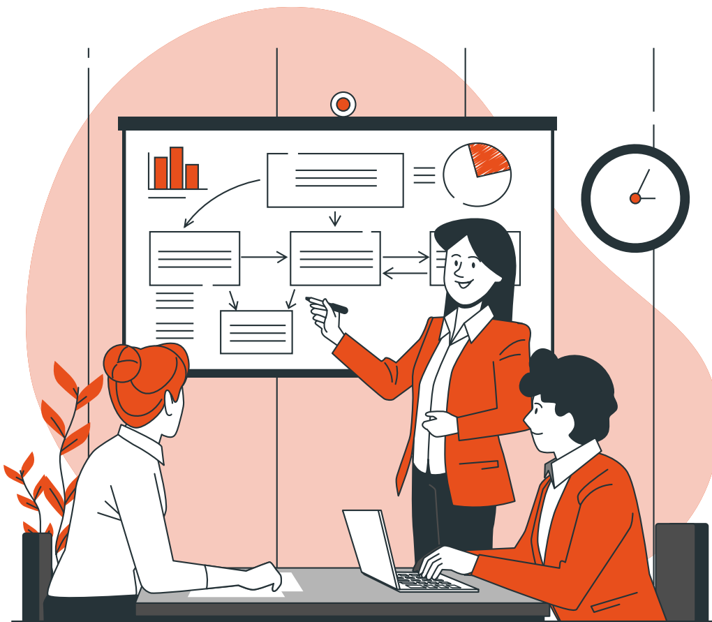
Illustration : storyset.com